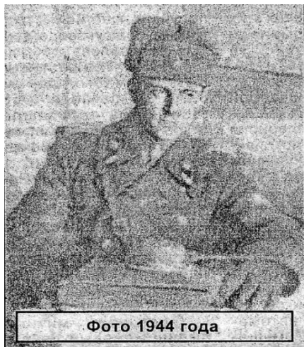
Фото 1944 года

Когда к нам подъезжала кухня, мы запах пищи чувствовали издалека, а