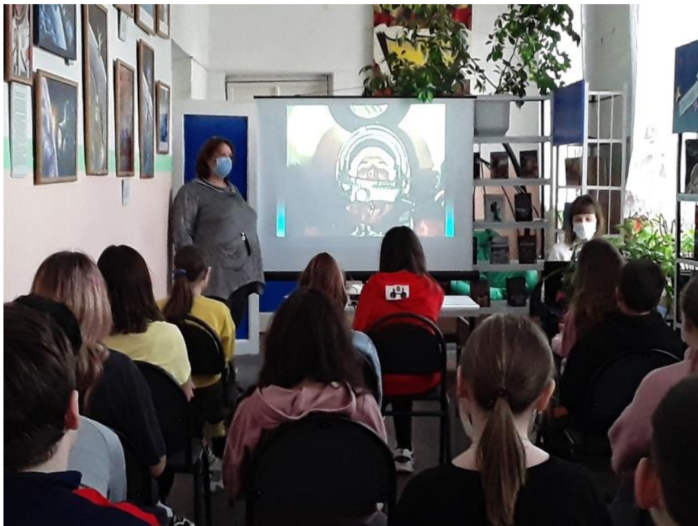
Космический дилижанс «Тайны звездного неба» (Городской библиотечный филиал №1)