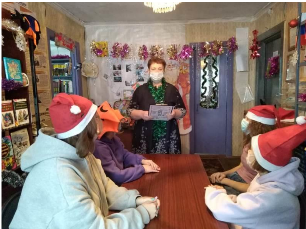
Игровой микс «Скоро, скоро Новый Год!» (Бельковский СБФ)