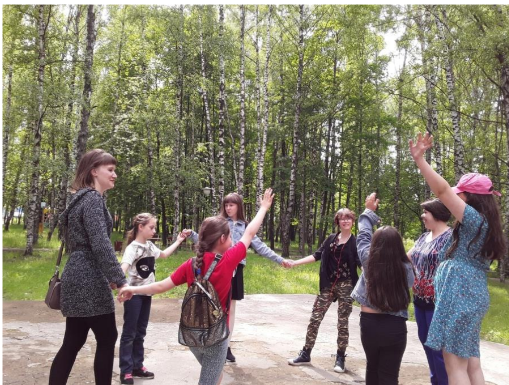
Дружеский хоровод «Вот оно какое, наше лето» (сотрудники ГБФ№1 в рамках проекта «Лето в парках»)

(в рамках проекта «Лето в парках» сотрудники Межпоселенческой центральной библиотеки)