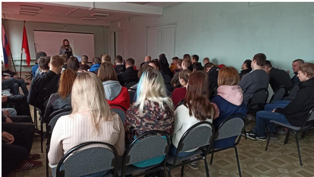
Тематический вечер «Открылась бездна, звезд полна...» (Межпоселенческая центральная библиотека для учащихся филиала ГПОО ТО «Тульский с/х колледж им. Ефанова»)