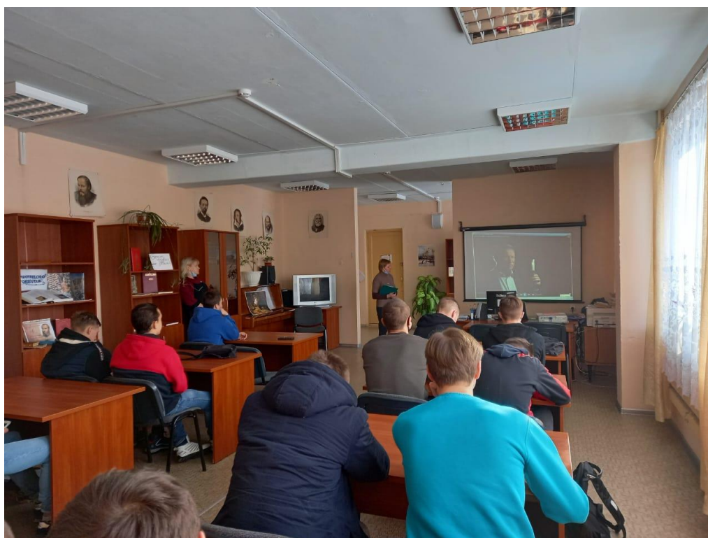
Урок мужества «Ленинград. Блокада. Память» (МЦБ в филиале ГПОО ТО «Тульский с/х колледж имени И.С. Ефанова»)