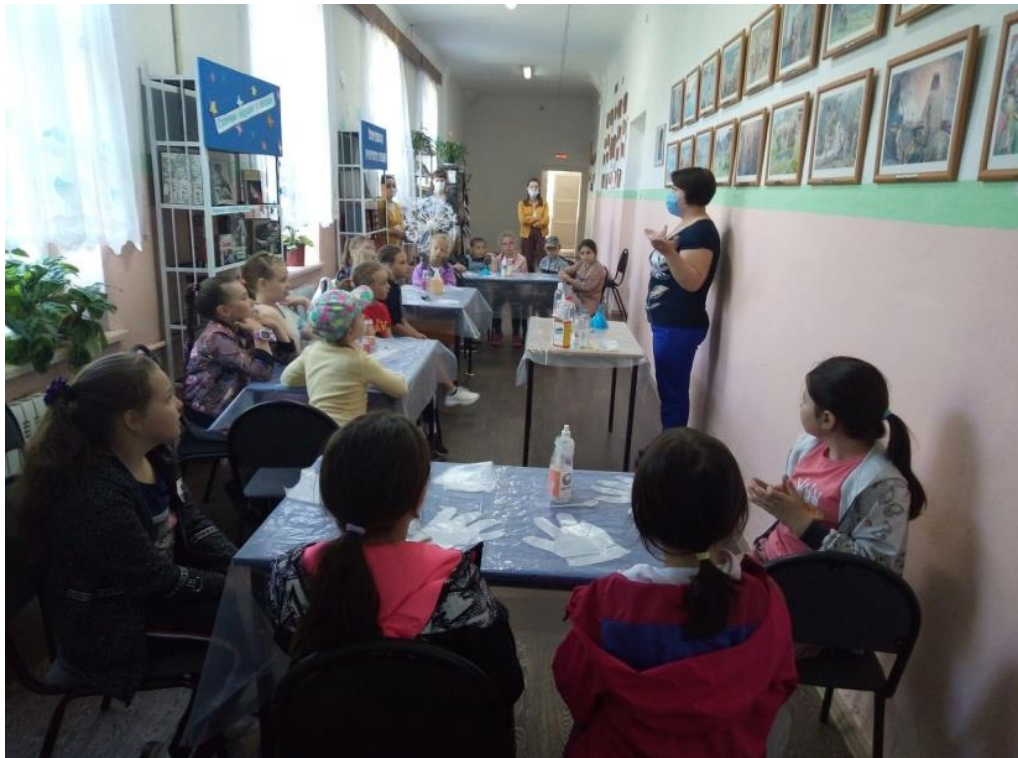
Академия волшебства «Веселые опыты» (в рамках Года науки и технологий в России в Городском библиотечном филиале №1)