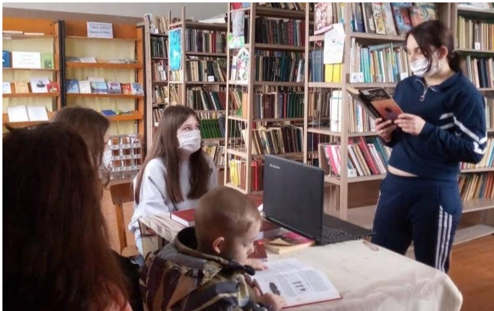
Час памяти «Чернобыльские колокола» (Озеренский СБФ)