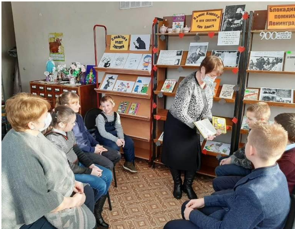
Литературная игра «Льюис Кэрролл и его сказки про Алису» (Кукуйский СБФ)