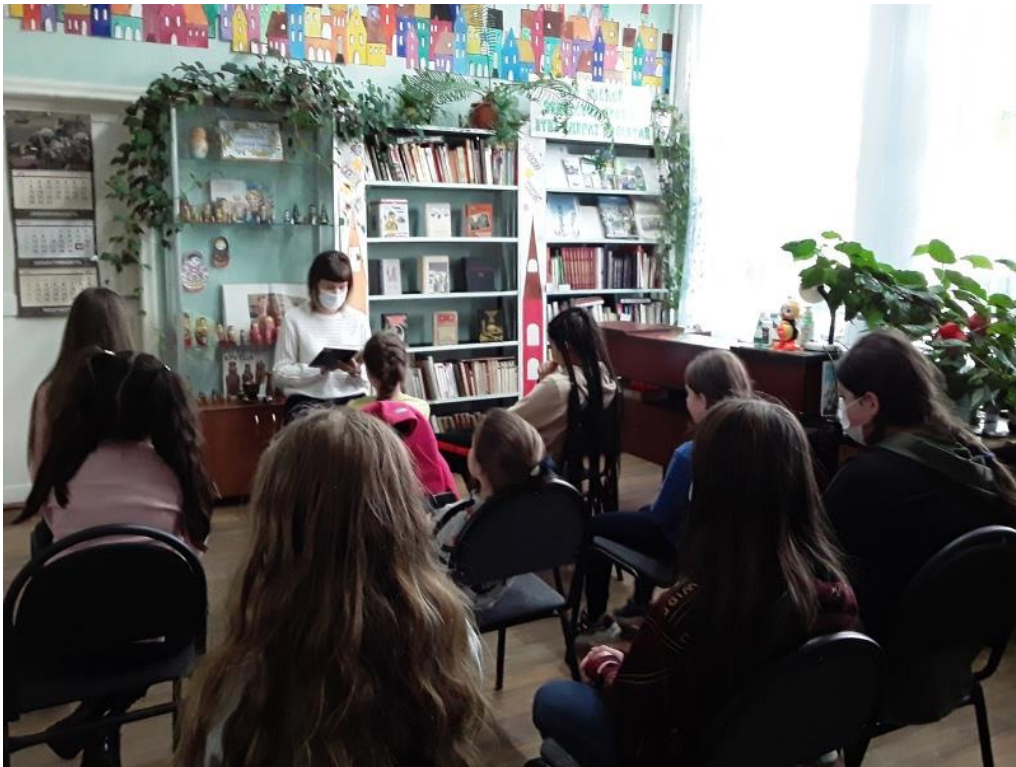
Арт-репортаж «Человек шагнувший к звездам» (Городской библиотечный филиал №1)