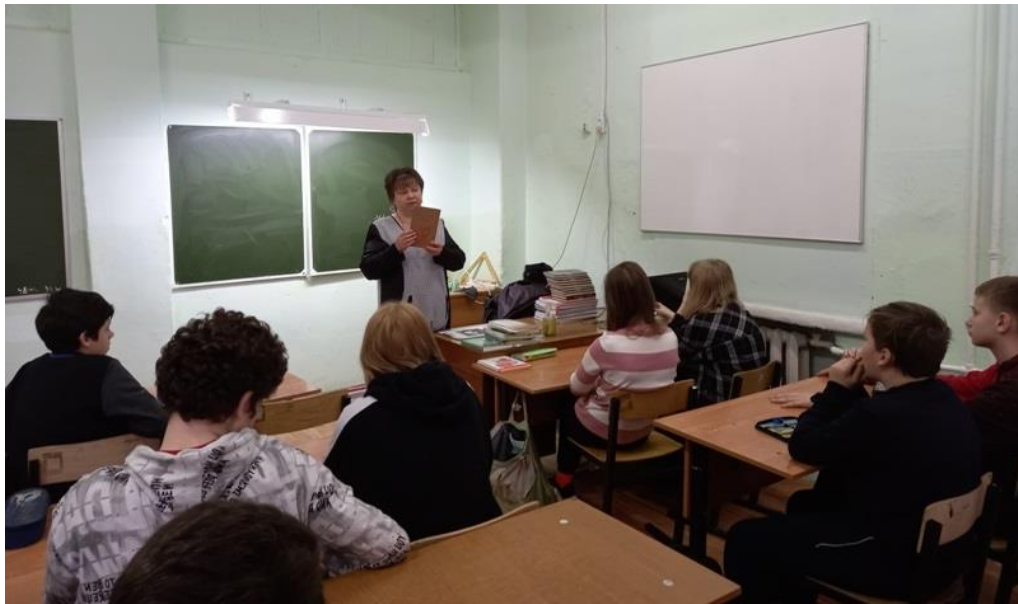
Урок мужества «Имя, ставшее легендой» (Метростроевский СБФ)