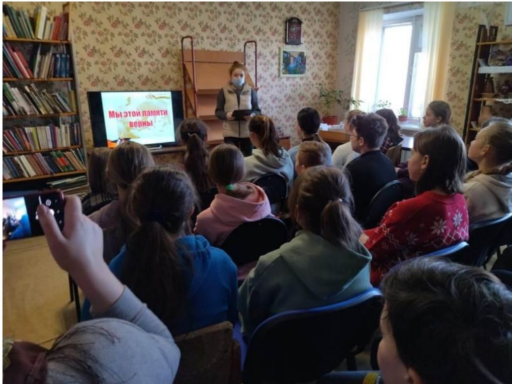
Час краеведения «Мы этой памяти верны», посвященный событиям 1941 года (Грицовский СБФ)