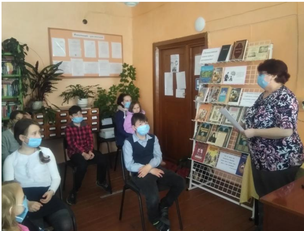
Беседа-игра «Все работы хороши — выбирай на вкус!» (Урусовский СБФ)