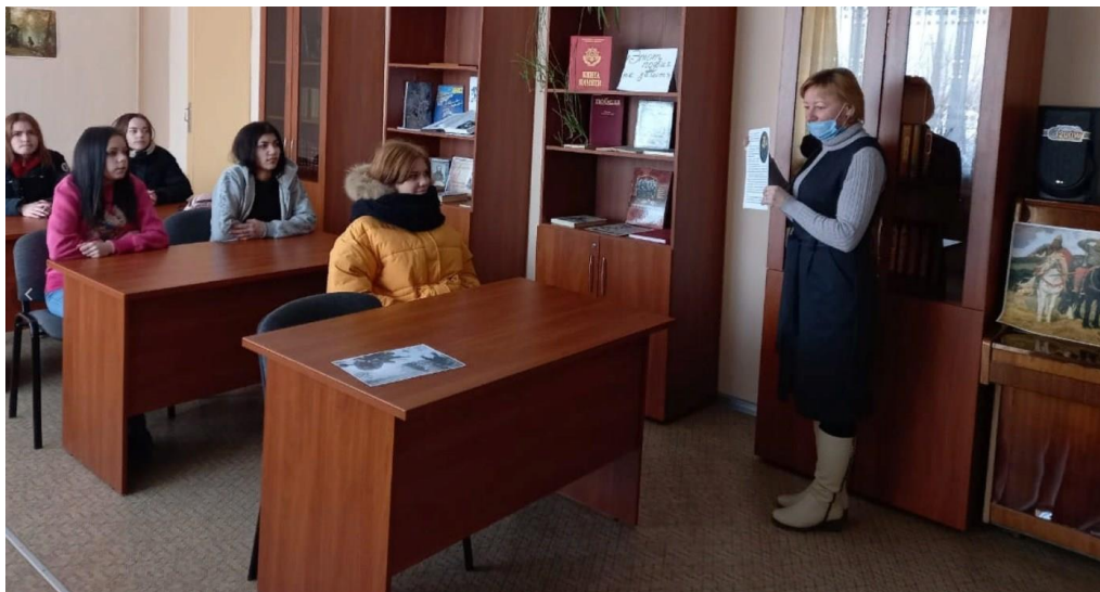
Краеведческий час «Пушкин и Веневский край» (МЦБ для студентов филиала ГПОУ ТО «Тульский с/х колледж имени И.С. «Ефанова»)