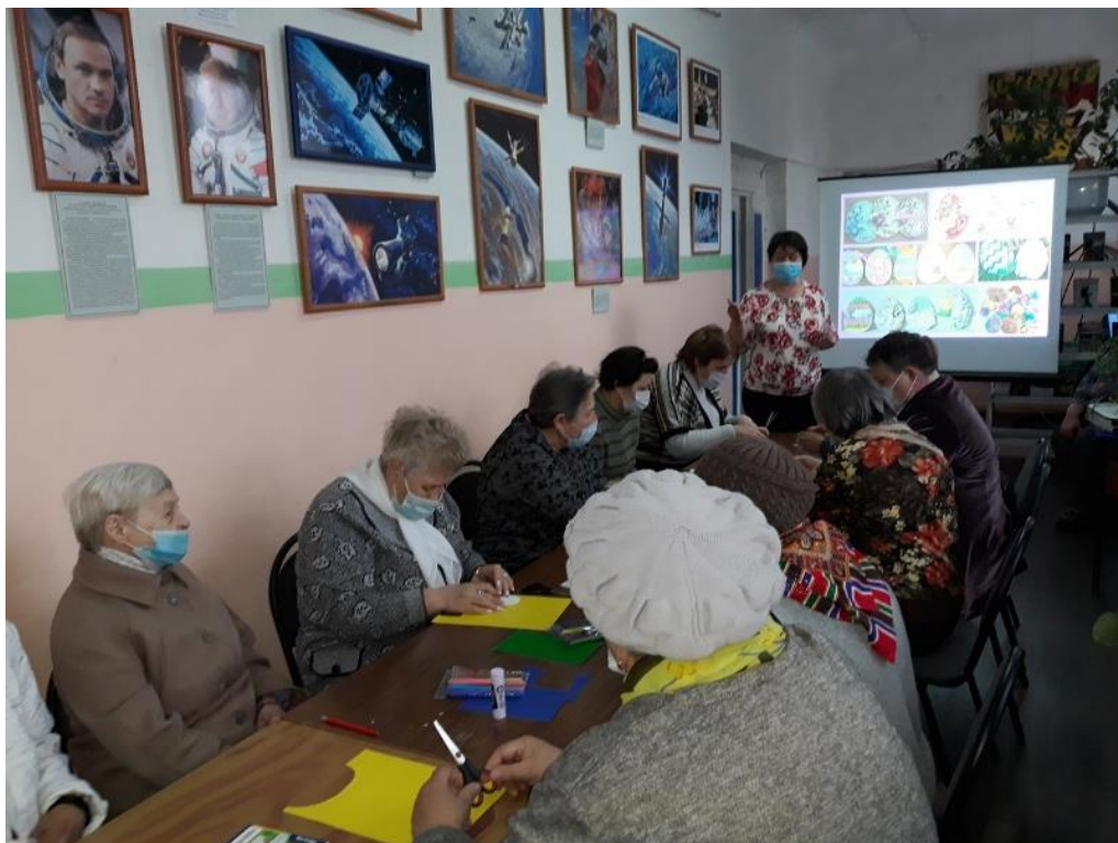
Мастер-класс «Пасхальный сувенир» (Городской библиотечный филиал №1 для подопечных Центра социального обслуживания)