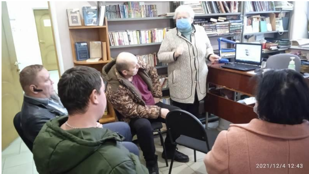
Онлайн-занятия по финансовой грамотности «Экономить для жизни» (Мордовский СБФ)