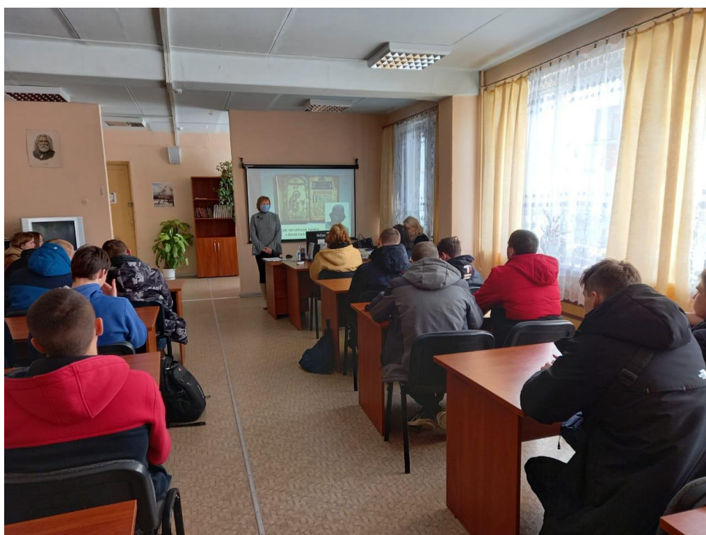
Православный час «Святые земли Русской» (Межпоселенческая центральная библиотека в филиале ГПОО ТО «Тульский с/х колледж имени И.С. Ефанова»)