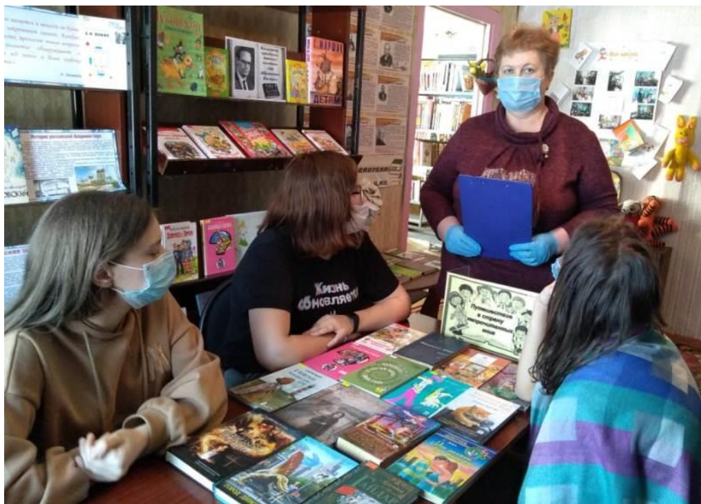
Библиотурне «Путешествие в страну непрочитанных книг» (Бельковский СБФ)