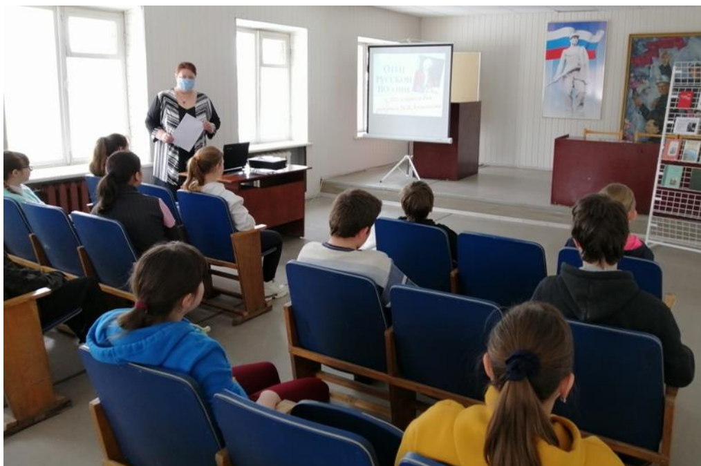
День поэзии «Отец русской поэзии», посвященный 310-летию со дня рождения М.В. Ломоносова (Грицовский СБФ)