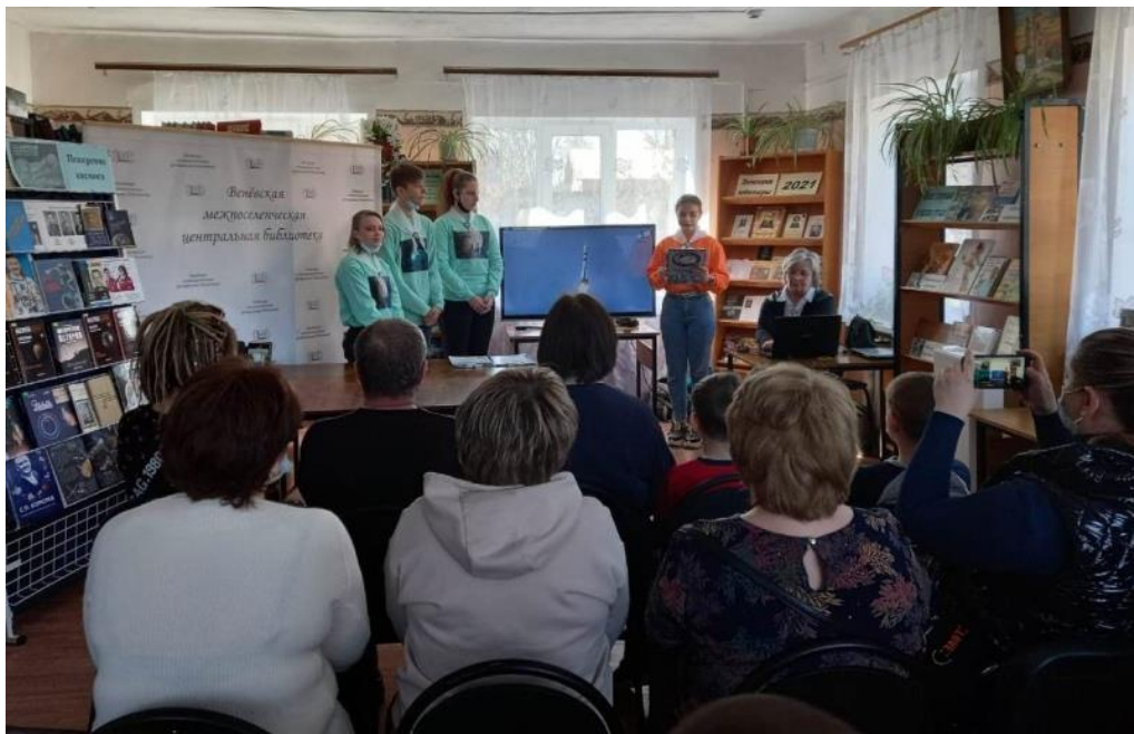
Веневские космостажеры Центра развития «Подними голову» провели на базе Межпоселенческой центральной библиотеки праздничное заседание, посвященное 60-летию первого полета в космос Ю.А. Гагарина.