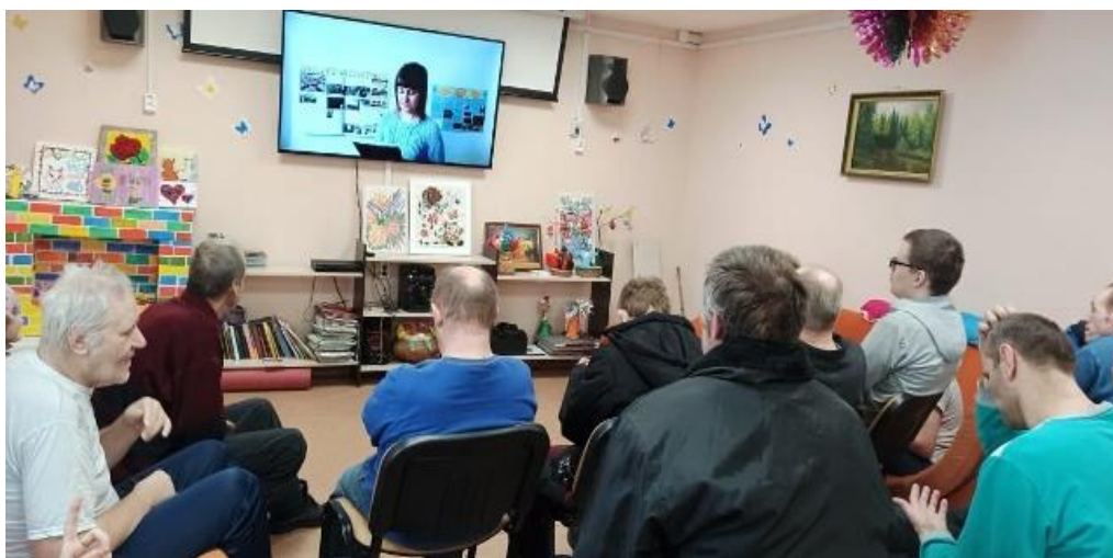
Видео-экскурс «Тульские улицы шли в ополчение» (для проживающих в ГУ ТО «Веневский психоневрологический интернат» Городской библиотечный филиал №1)