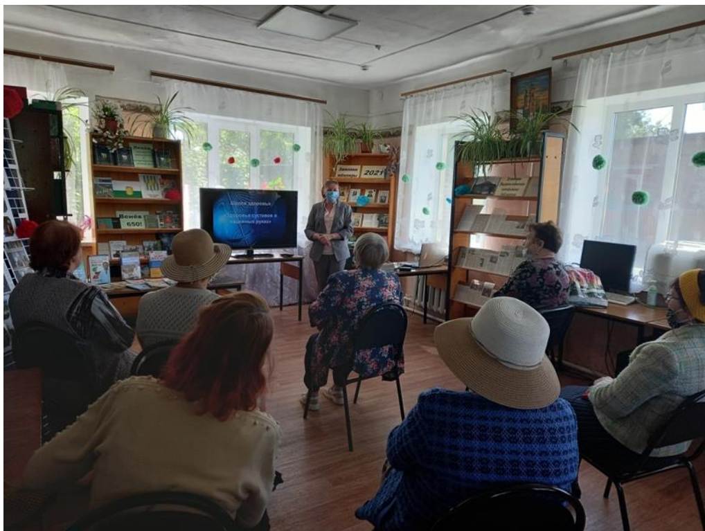
Час здоровья «Здоровье суставов в надежных руках» (Межпоселенческая центральная библиотека)