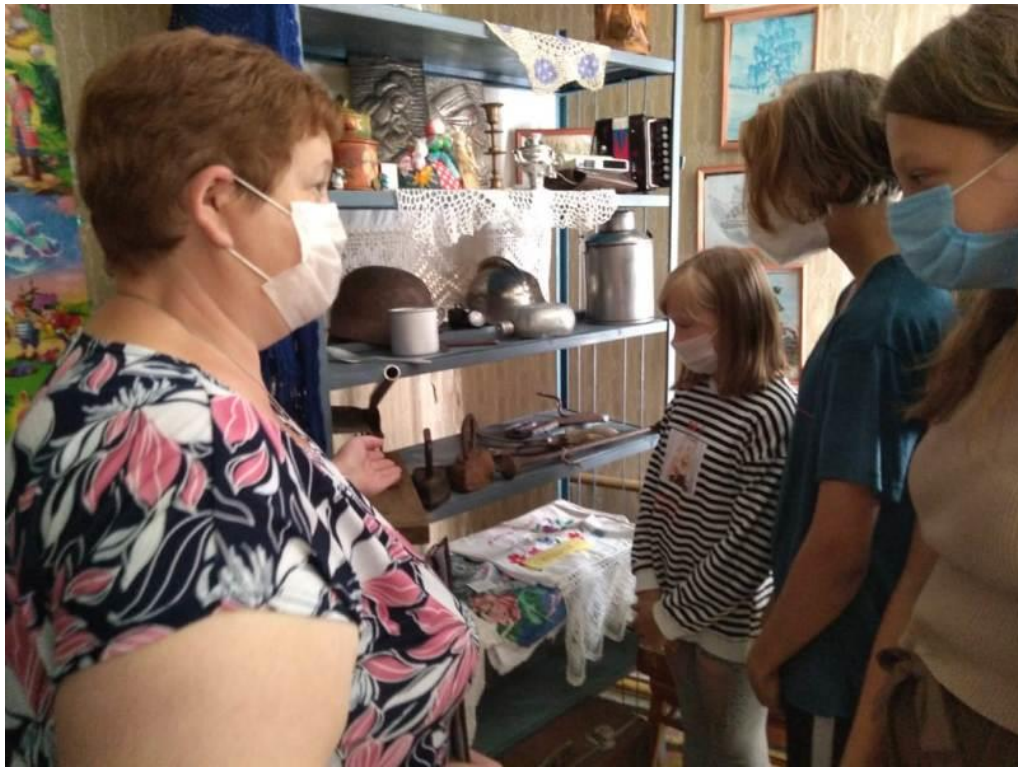
Познавательное турне «Путешествие в прошлое утюга» (мини-музей «Хранители разного времени» в Бельковском СБФ)