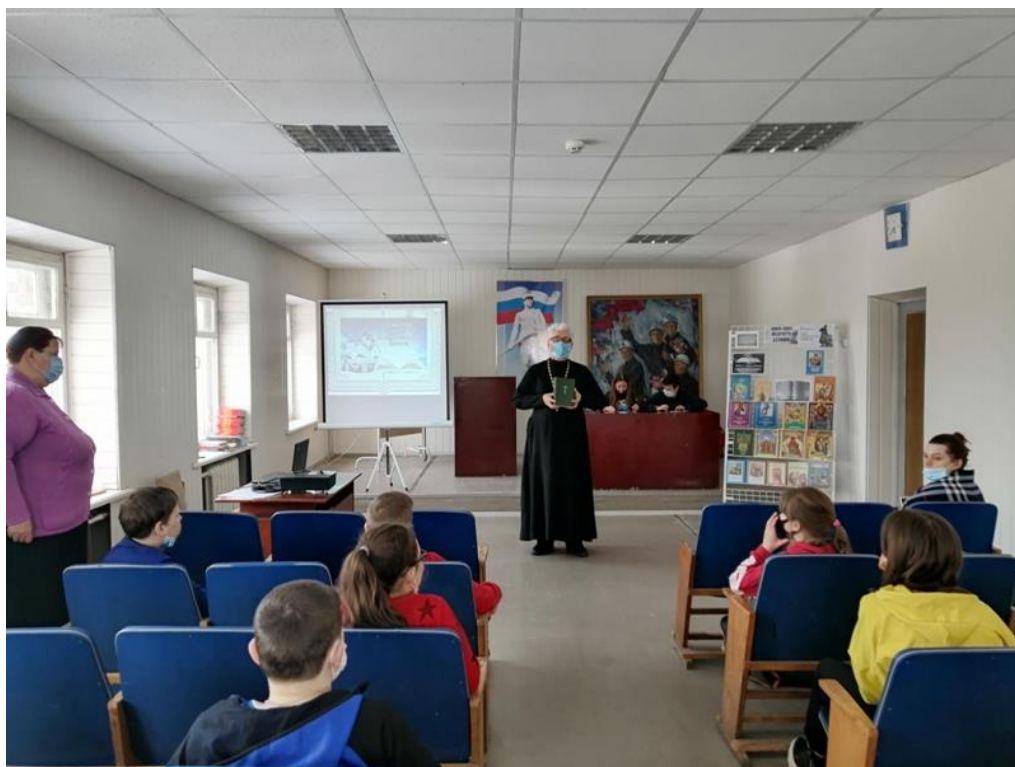
Информационный час «Живое слово мудрости духовной» (Грицовский СБФ)