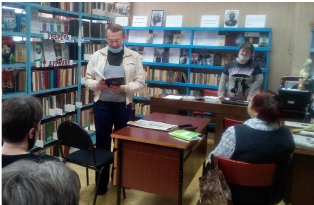
Встреча объединения единомышленников «Краеведческий четверг» на тему «Поэты родного края» (Метростроевский СБФ)