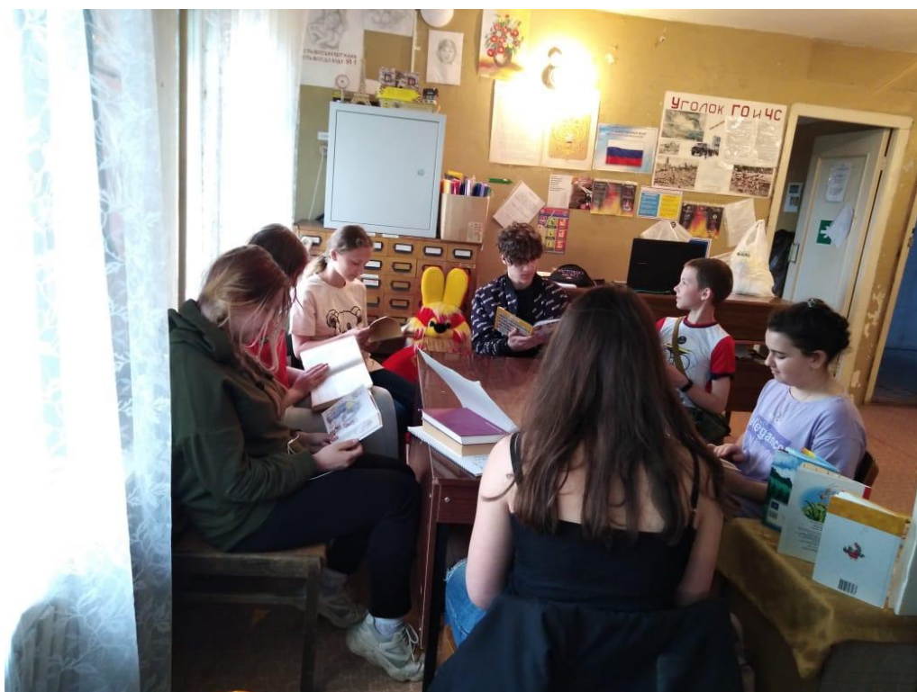
Встреча юных читателей «За круглым столом» (Студенецкий СБФ)