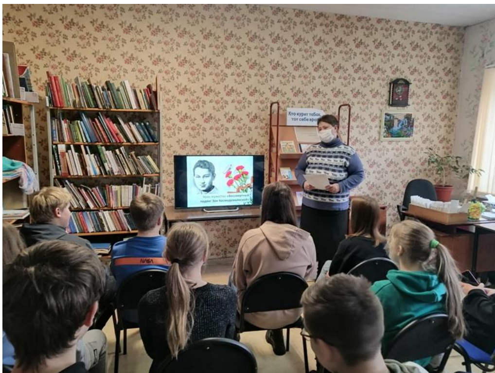
Урок мужества «Бессмертный подвиг Зои Космодемьянской» (Грицовский СБФ)