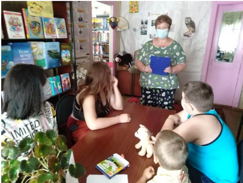
Эко-квест «Экологический дозор» (Бельковский СБФ)