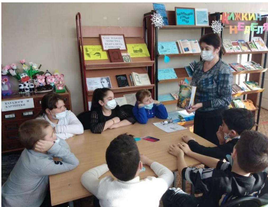
Экологический марафон «Загадочная стихия — вода» (Кукуйский СБФ)