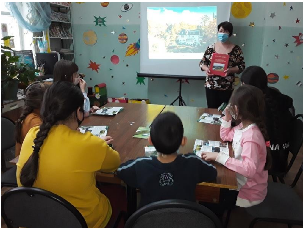
Заочное путешествие «Заповедная Россия» (Городской библиотечный филиал №1)