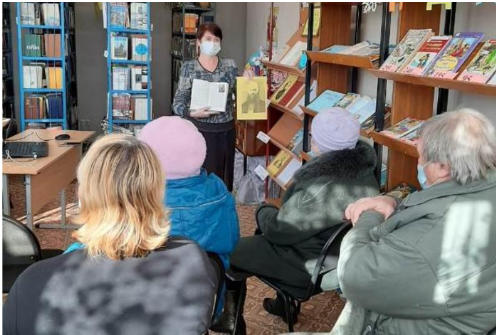
Литературно-краеведческий альманах «Щедра тульская земля талантами!» (Кукуйский СБФ)