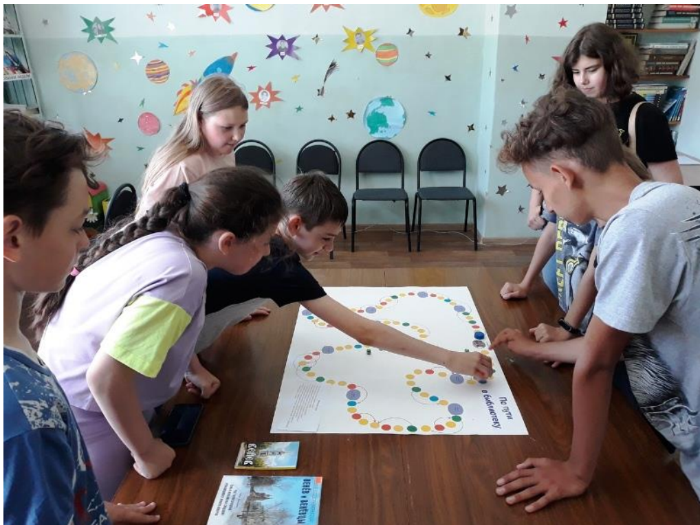
Турнир по краеведческим настольным играм «По дорогам любимого города» (Городской библиотечный филиал №1)