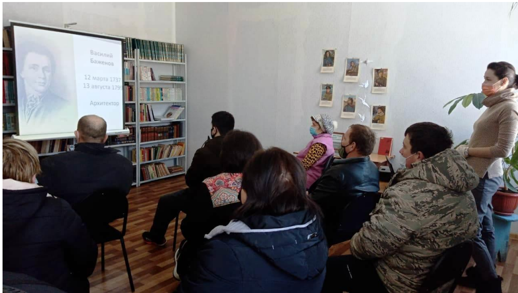
Информационный час «Василий Баженов. Жизнь и творчество» (Мордовесский СБФ)