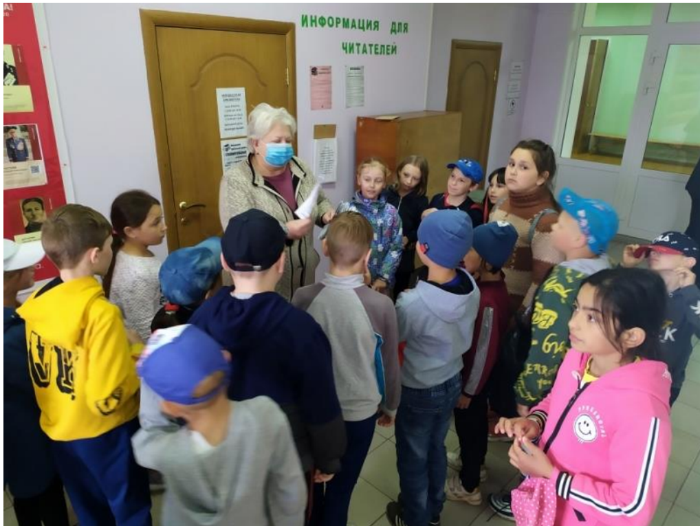
Патриотический час «Вместе мы — страна Россия» (Мордвесский СБФ)