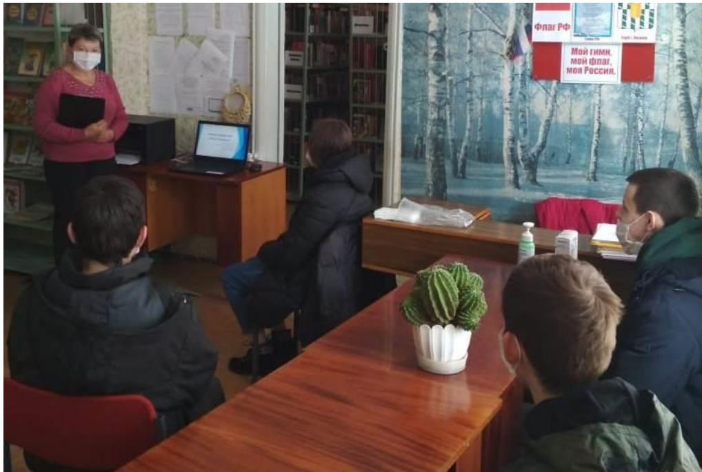
Видеопрезентация «Выбор профессии — выбор будущего» (Тулубьевский СБФ)