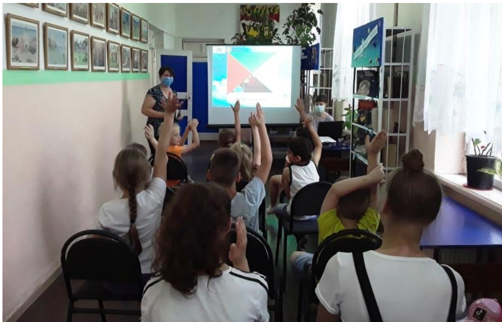
Эко-игротека «Загадки мудрого филина» (Городской библиотечный филиал №1)