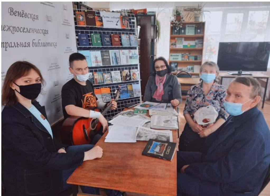
Музыкально-поэтическое заседание литературной студии «СТИХиЯ» на тему «Пусть говорят стихи» (Межпоселенческая центральная библиотека)