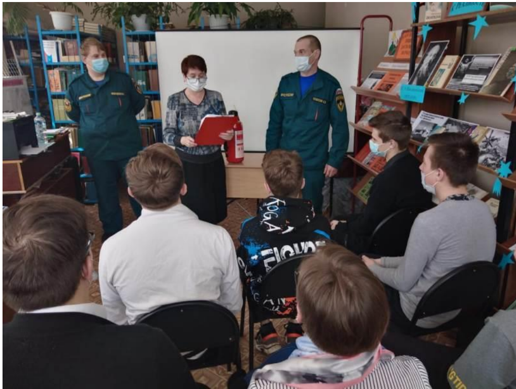
Познавательный час по профориентации «Я б в пожарные пошёл – пусть меня научат!» (Кукуйский СБФ)