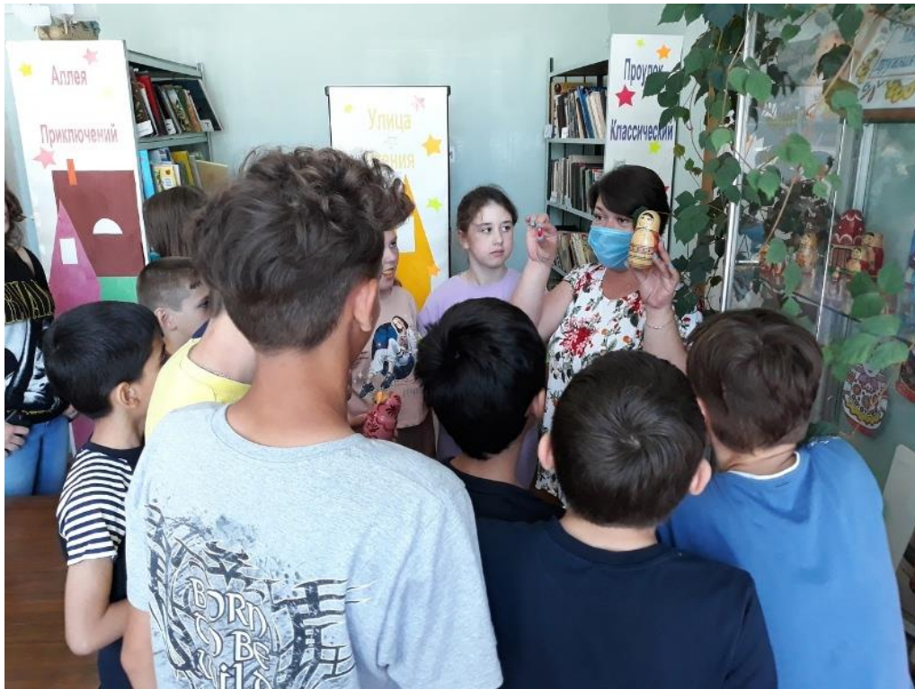
Экскурсия по мини-музею матрешек Городского библиотечного филиала №1.