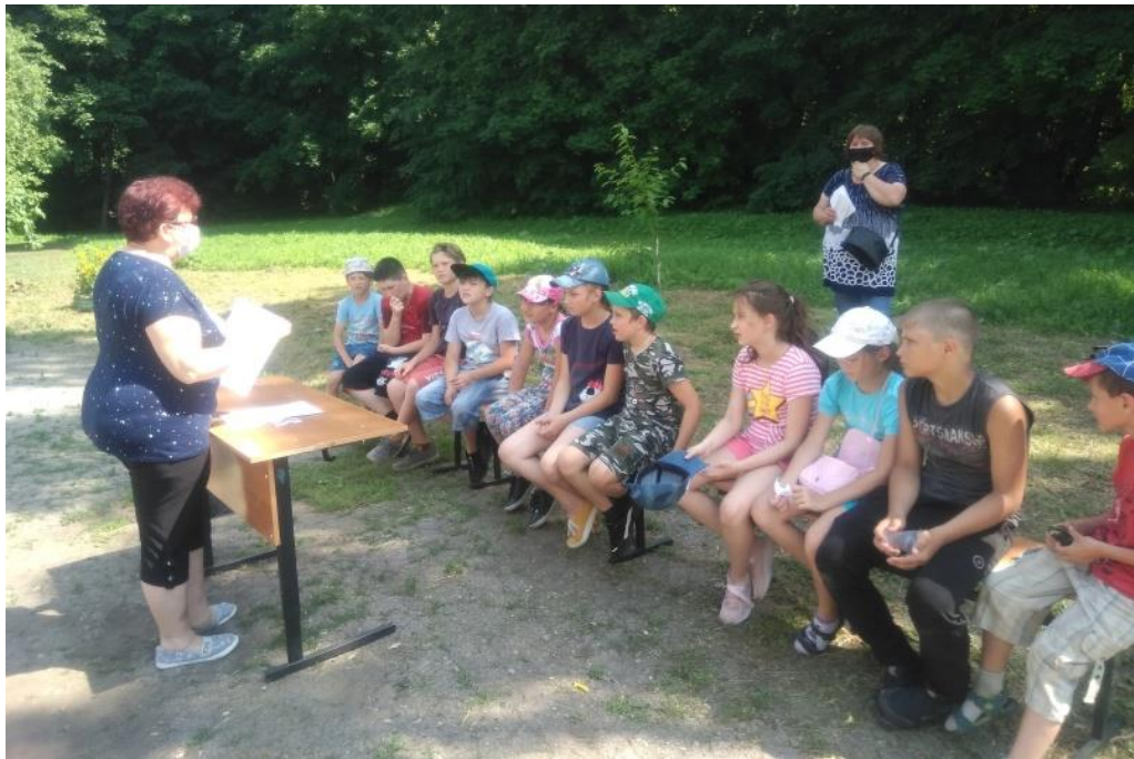
Литературно-экологическая игра «Путешествие в лес – страну чудес» (Урусовский СБФ)