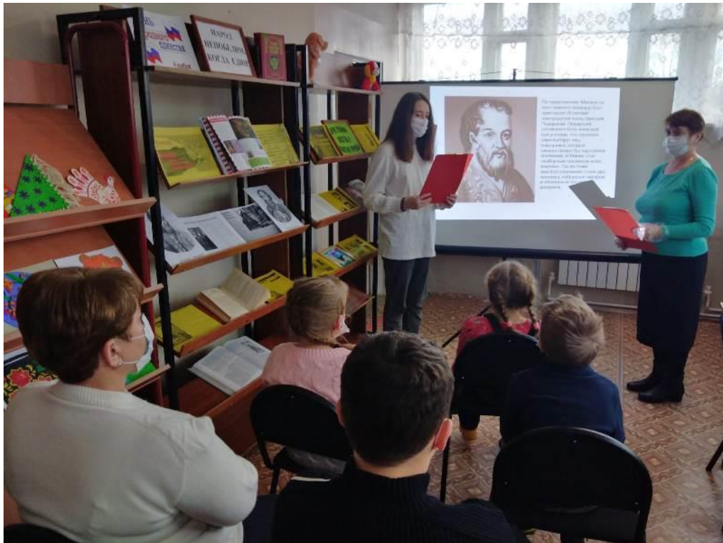
Исторический экскурс «Народ непобедим, когда един!» (Кукуйский СБФ)