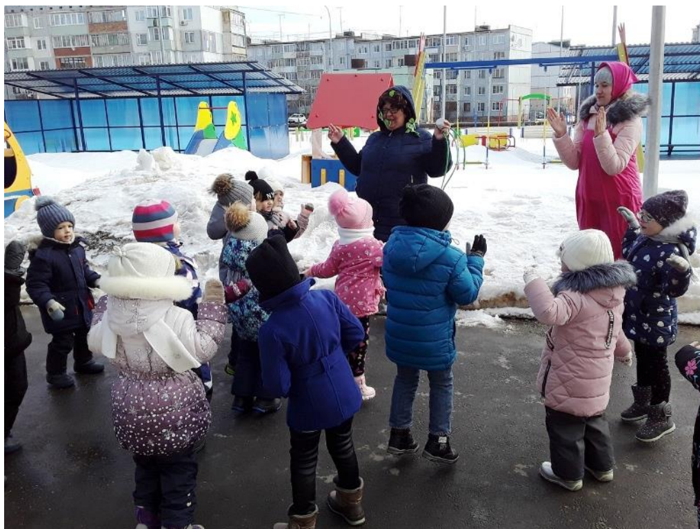
Театрализованное представление «Книжка открывается, сказка начинается» (Городской библиотечный филиал №1)