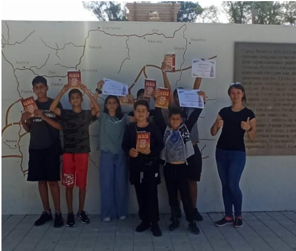
Участие сотрудников городских библиотек в праздничных мероприятиях к 650-летию Венева на Красной Площади.