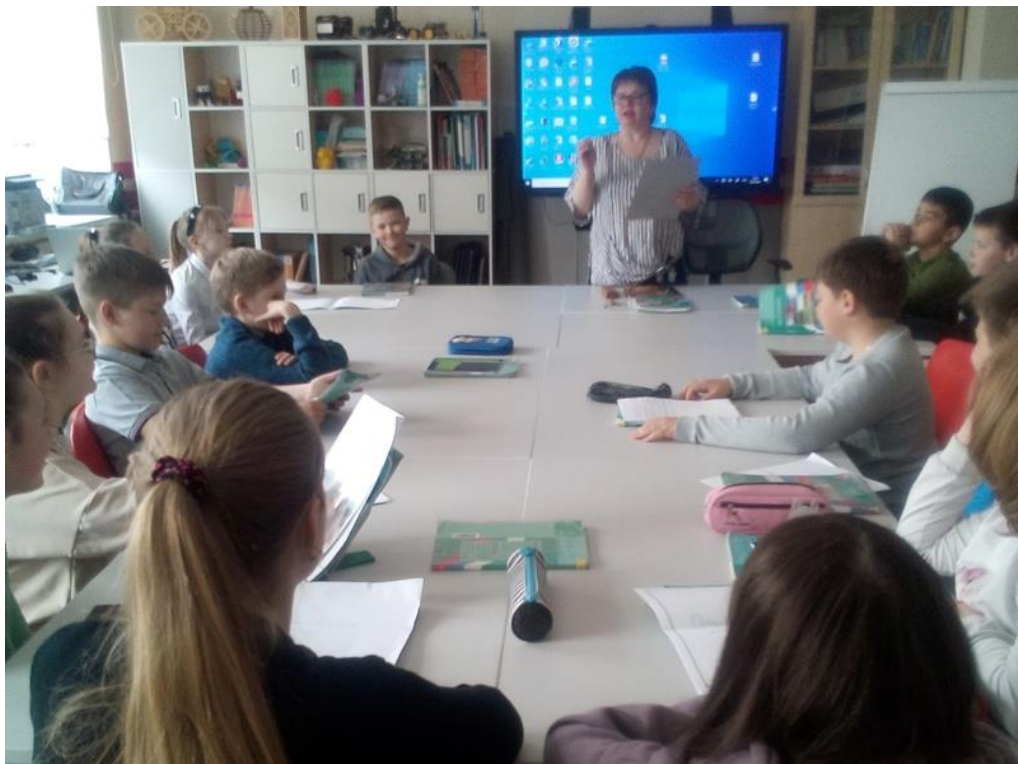
Час краеведения «Малый город, большая история» (Метростроевский СБФ)