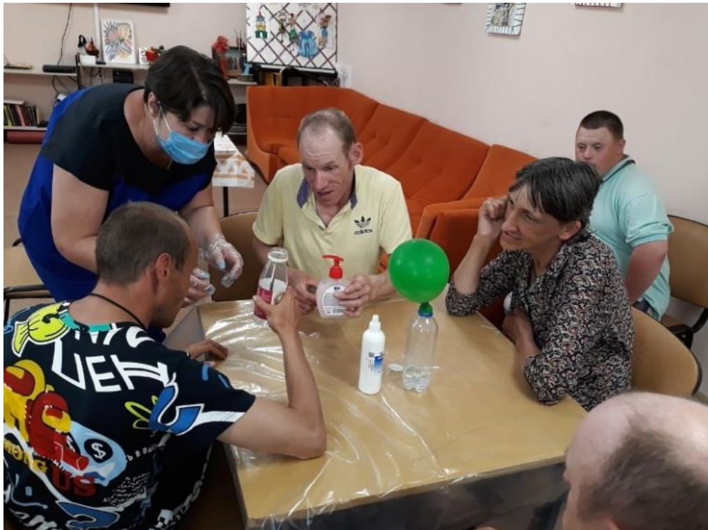
Сотрудники Городского библиотечного филиала №1 провели эксперимент-шоу «Чудеса из ничего» для проживающих в Веневском психоневрологическом интернате.