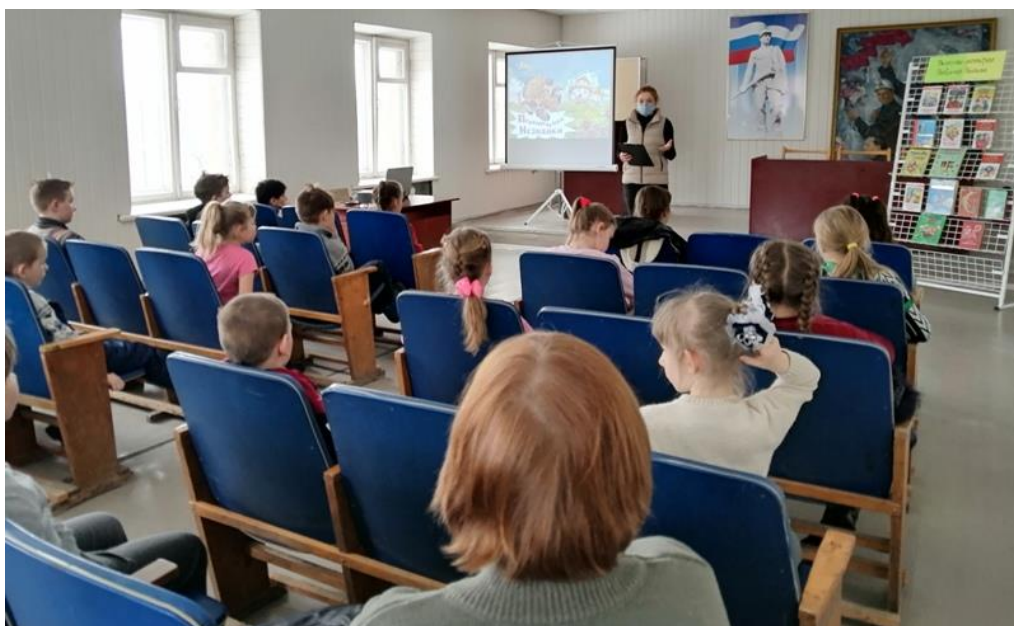
Литературная викторина «Приключения Незнайки» (Грицовский СБФ)