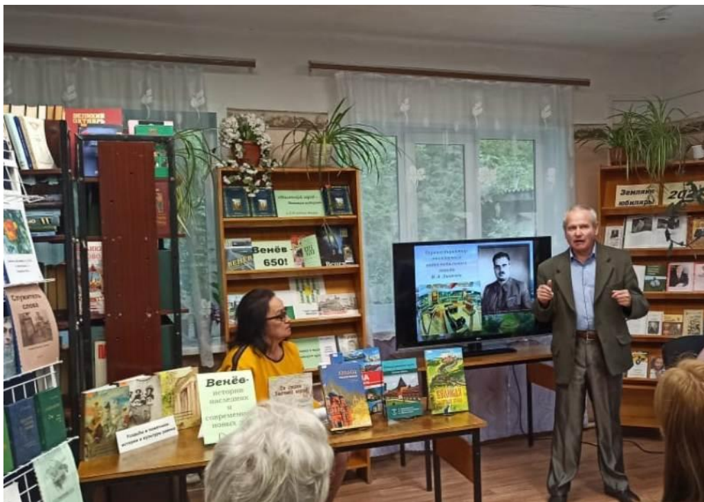
Круглый стол «Маленький город — большая история» (к 650-летию Венева в Межпоселенческой центральной библиотеке)