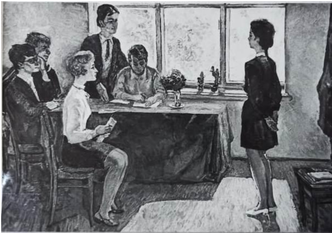
Прием в комсомол, 1975г., холст, масло (картина на заказ)