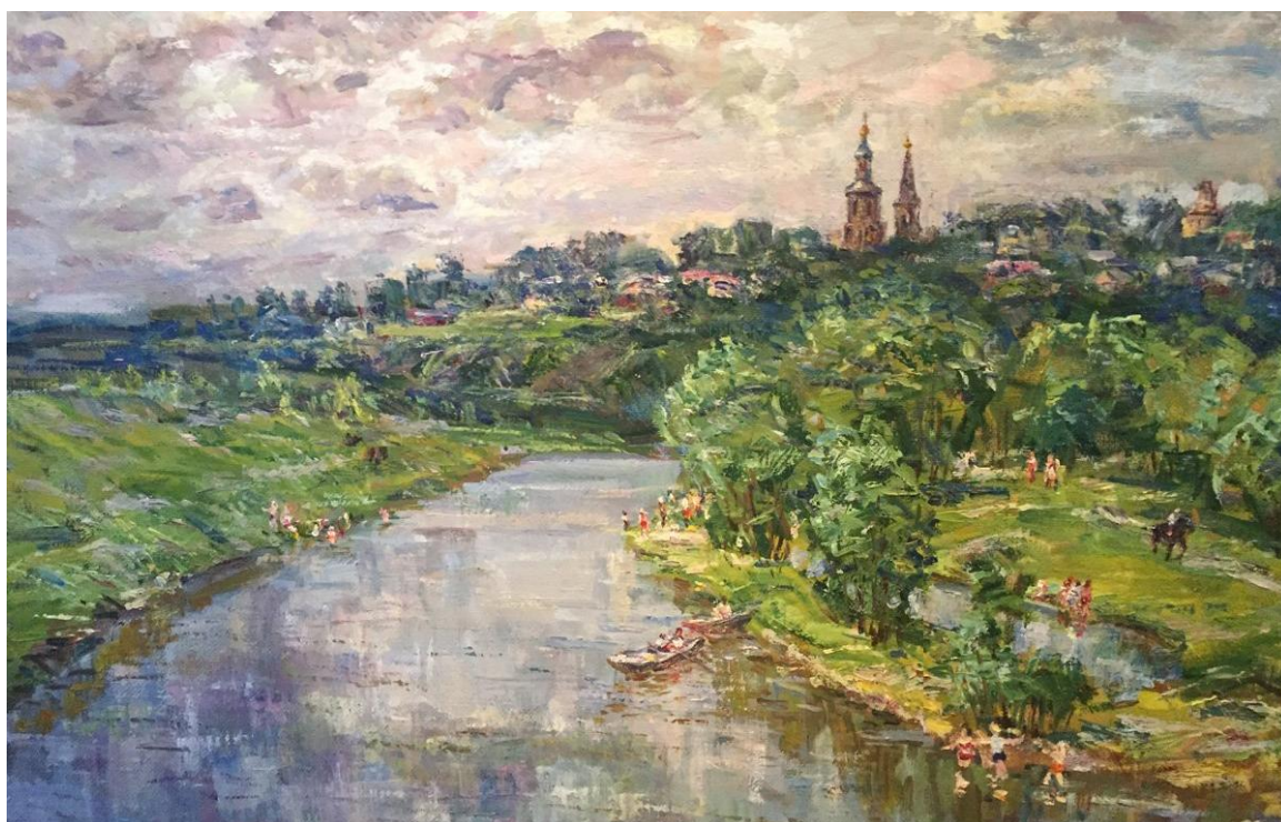
Река Веневка, холст, масло