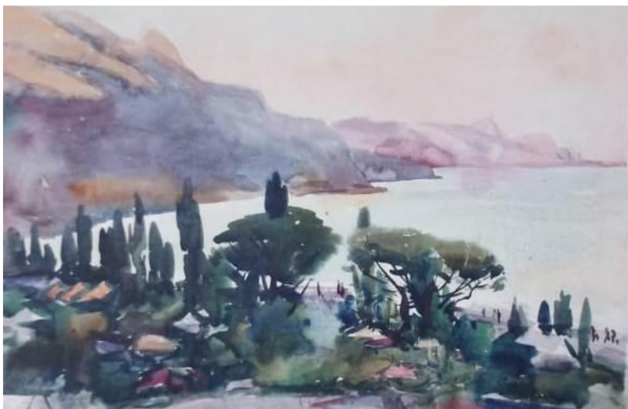
Южный поселок «Рыбачье», 1978г.