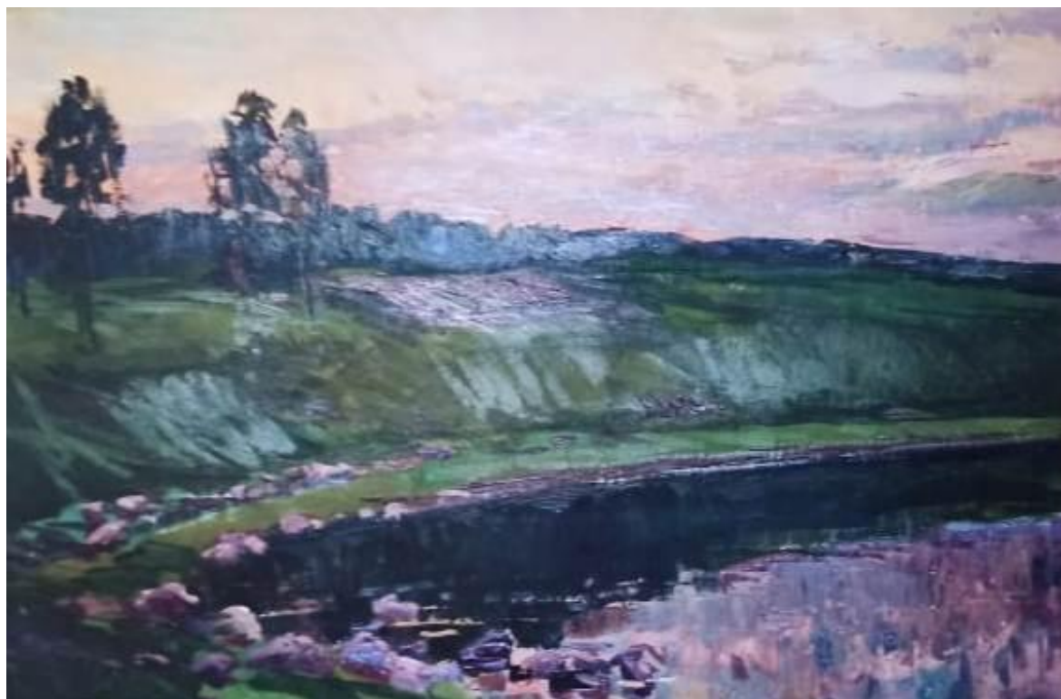
Веневка под нашим берегом (ул. Коммуны) (вечер, если смотреть на Озеренцы), 1968г.