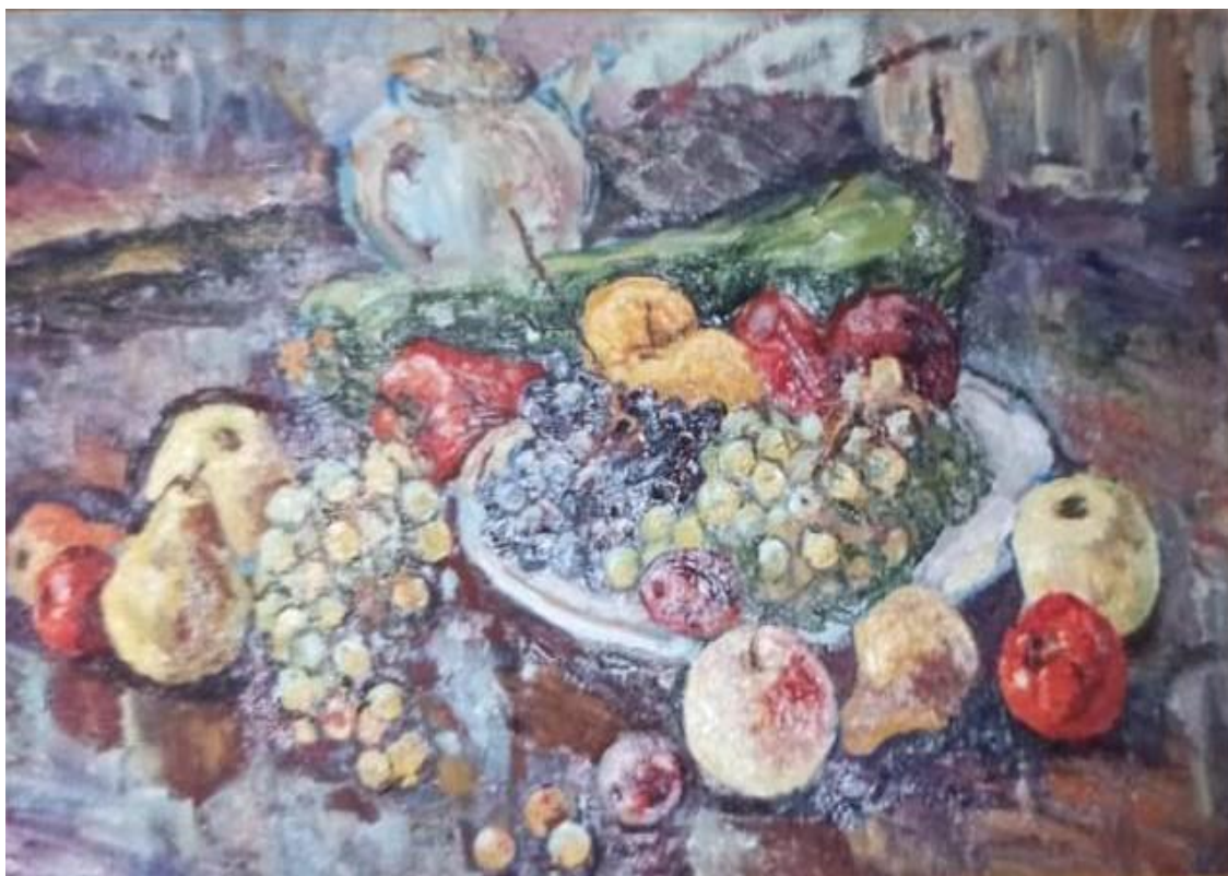
Натюрморт, холст, масло