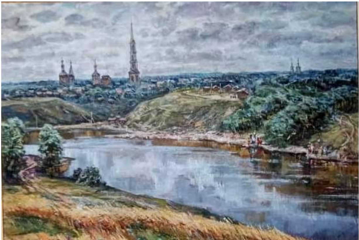
Вид на Венев с Пушкарских бугров, 1979г., холст, масло