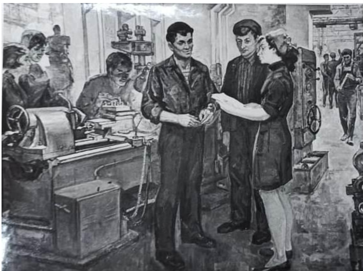
Молодежь на производстве, 1972г., холст, масло (заказная работа)