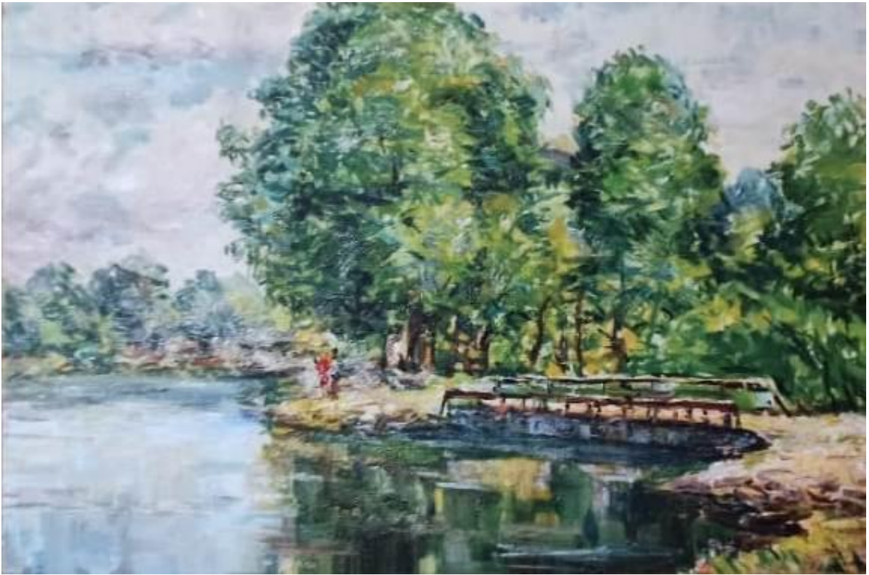
Река Веневка, 1975г., холс, масло