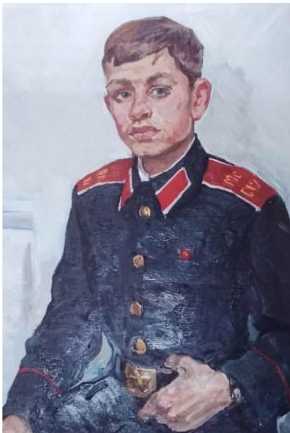
Суворовец, холст, масло (во время учебы)