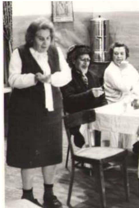
Сцены из постановки «Идиот» и «Выходили бабки замуж» (1992 г.)