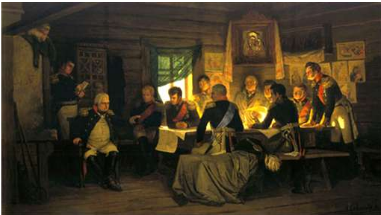
«Военный совет в Филях»

А. Кившенко оставил богатое наследие. Его лучшие картины хранятся в музеях и в Третьяковской галерее. Несколько полотен Кившенко экспонируются в Тульском областном художественном музее.