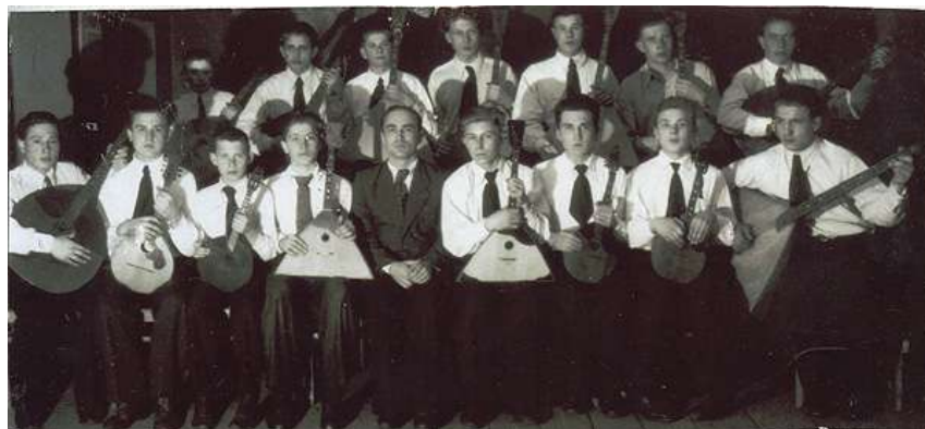
Оркестр струнных инструментов 1952 года

В общей сложности через веневский оркестр прошли около 300 человек.