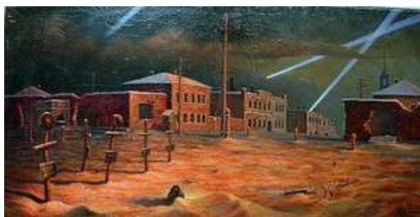
«Венев после освобождения города» (1962)