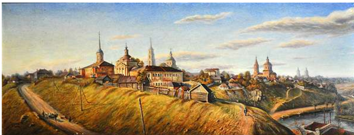
«Венев 1930 г.»