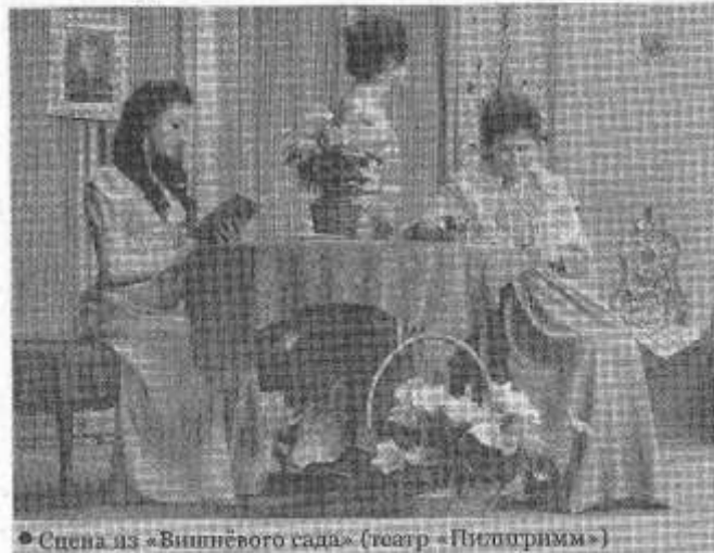
◆ Сцена из «Вишневого сада» (театр «Пилигримм»)