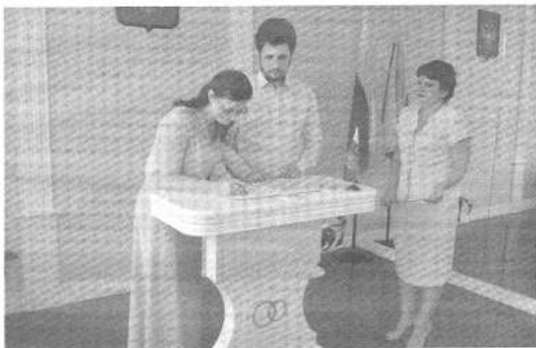
Регистрация молодой пары

Святых Петра и Февронию Муромских почитают в народе как покровителей семейного очага, хранителей супружеской любви.