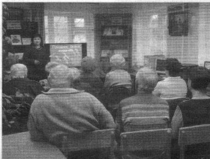
Праздник начался песней «Журавли»

Подготовила Татьяна ЯКУШИНА