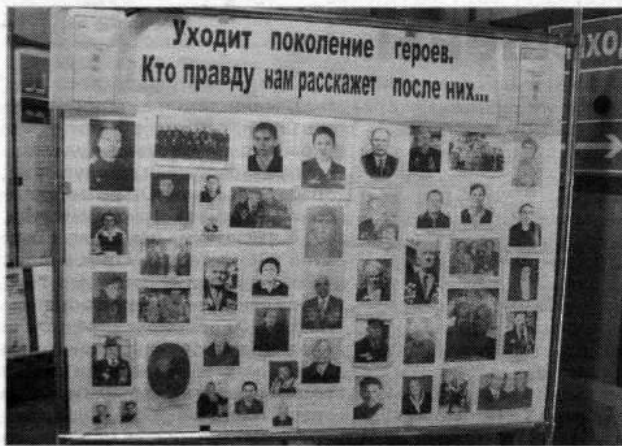
Стенд памяти в Центральной библиотеке города

С 27 июня по 13 июля на портале правительства Тульской области проходило голосование по названию проекта, единого электронного банка данных о героях Великой Отечественной войны, чья судьба связана с тульским краем.