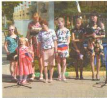
Юные читатели подготовили стихотворения