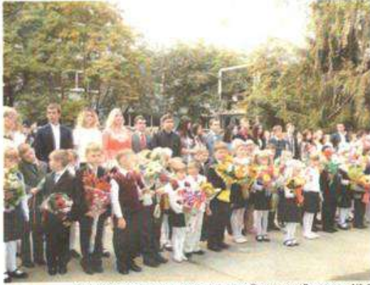
Выпускники и первоклассники Вeneвской школы № 1

Первого сентября школы региона приняли своих учеников. В преддверие этого важного дня образовательные учреждения были подготовлены по всем правилам к встрече обучающихся и приняты чиновниками, сотрудниками МЧС, Роспотребнадзора и пожарного надзора.