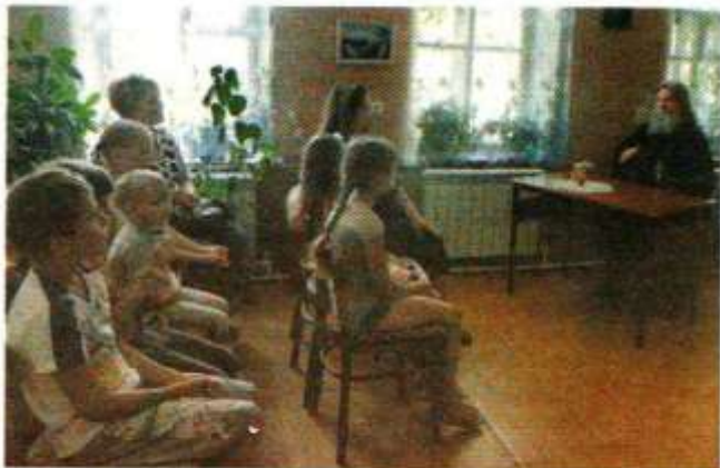
Участники литературного вечера

В детской библиотеке-филиале 8 июля прошел литературный вечер «Семья - любимых царство и образец святых» посвященный Дню семьи, любви и верности.