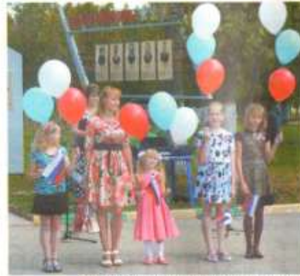
В небо были выпущены воздушные шары