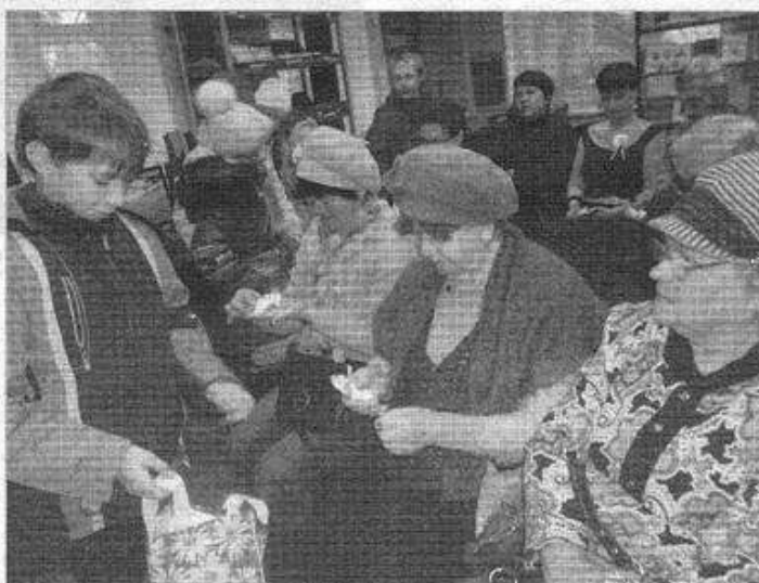
Ребята подарили бумажных журавликов

Т. Якушина. «День белых журавлей»// Красное знамя.- 2015.- 29 окт.- с.12