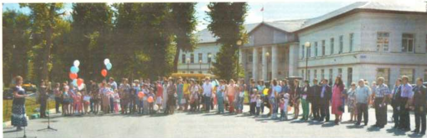
Участники праздника исполнили гимн Российской Федерации