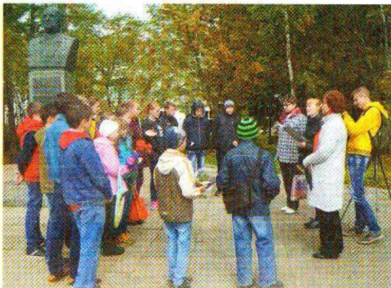
Ребята с интересом участвовали в квесте

Затем участники квеста отправились на братскую могилу. Ответив на вопросы и возложив цветы, ребята проследовали к монументу «Зенитно-артиллерийская пушка», где всех ждал небольшой сюрприз - в это время в Веневе также проходил и автопробег, ко-