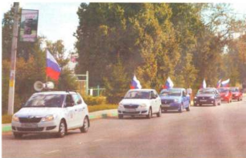
Украшенная флагами колонна проехала по улицам города

Завершился праздник торжественным проездом по центральной улице Тулы автомобилей, принимавших участие в патристической акции, а это 193 автомобилиста как из областного центра, так и жители других районов Тульской области.