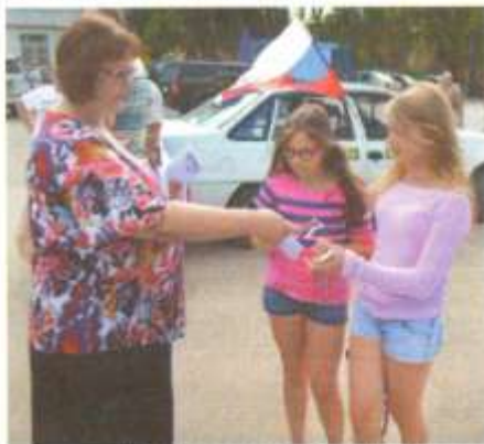
На площади раздавали ленточки-триколор