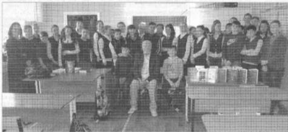
Встреча прошла в Мордвесской школе имени В. Ф. Романова

2015 год - Год литературы, и библиотеки муниципального учреждения культуры «Межпоселенческая централизованная библиотечная система» в течение года проводили много самых разнообразных мероприятий в поддержку чтения и литературы, стараясь донести до слушателей важность приобщения к регулярному чтению, потому что литература помогает постигать сложность и многообразие мира, развивает способность мыслить, приобщает к искусству слова, развивает наши чувства.