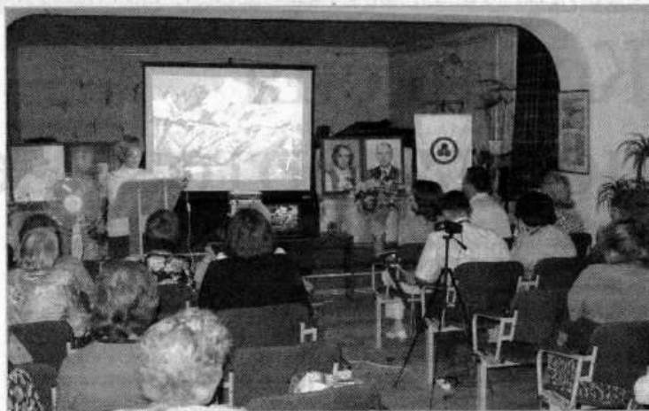
Собравшиеся с интересом слушали выступающих

В программе чтений прозвучали стихотворения, музы-