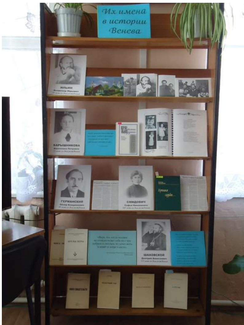
Фото выставки « Они вошли в историю Венева»